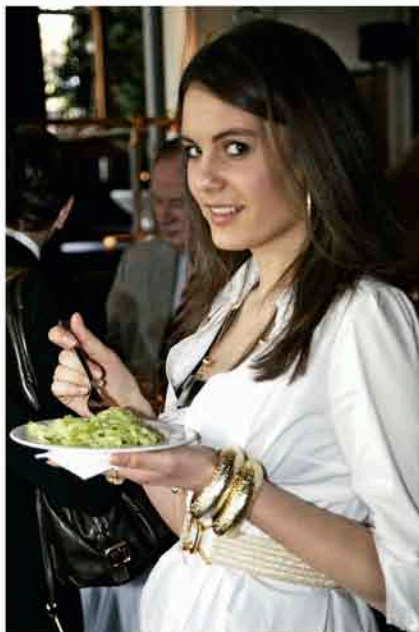
Bild links: Ehemaliger Präsident des Bundesverbandes der Industrie Dr. Michael Rogowski Bild mitte: Wie soll es auch anders sein, die Figur muss gehalten werden – ein Salätchen für Iga Bild oben: Renate Jelitto und Petra Wahl – auch sie hatten einen schönen, lustigen Abend und freuten sich über viele neue Kontakte