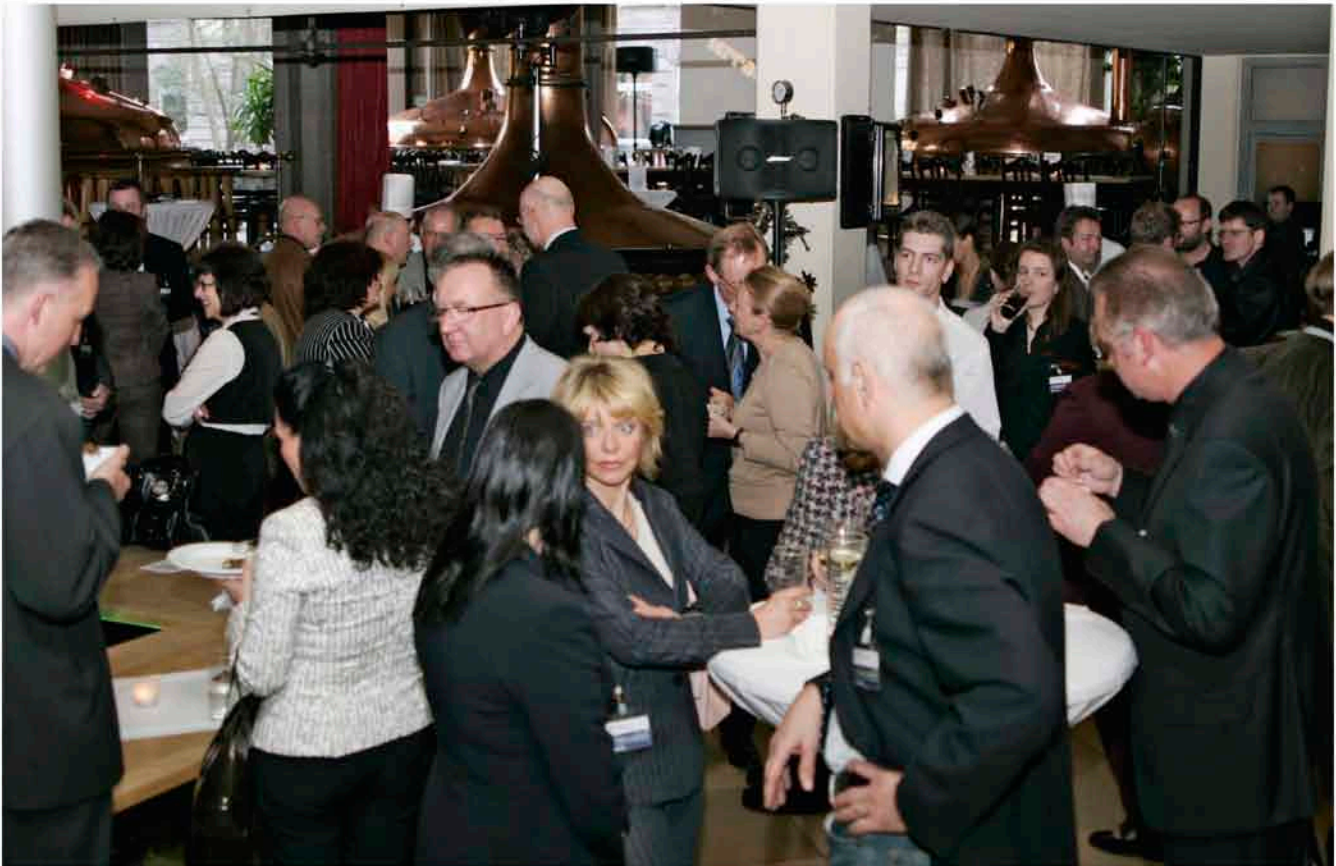
Wie immer eine rundum gelungene Veranstaltung. Wir freuen uns schon auf die Nächste!